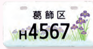
▲花しょうぶ(原付I種)

区制施行90周年を記念して、区にゆかりのあるキャラクターなどをデザインした原動機付自転車のナンバープレート(ふるさとナンバープレート)を作成しました。各デザイン3色あります。