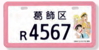
▲こち亀デザイン(原付II種甲)