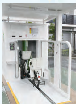
▲ 自転車を収納する様子

学生や身体障害者手帳をお持ちの方など、利用料の減額を受けられる場合があります。詳しくはお問い合わせください。