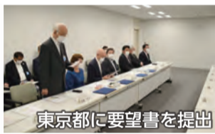
東京都に要望書を提出