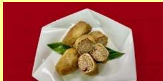
令和3年度最優秀賞「野菜たっぷり油揚げ煮」

電話 03-5654-8273 FAX 03-5698-1534 メールアドレス 060800@city.katsushika.lg.jp