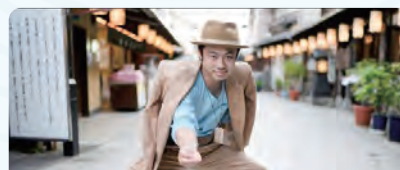
観光大使になりました

任命式に先立ち、5月24日にフィッシャーズのYouTubeチャンネルで、柴又の魅力を紹介してくれました。