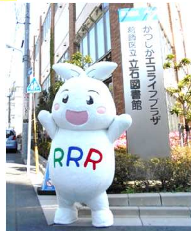
葛飾区ごみ減量・3R推進キャラクター リー (Ree) ちゃん