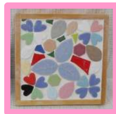
端材で作る モザイクタイル