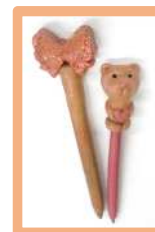
おがくず粘土工作 「えんぴつ作り」