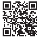
△区公式フェイスブック

イベント情報・観光情報や地域の出来事など、葛飾の魅力配信します。また、災害に関する情報をできる限り迅速に配信します。