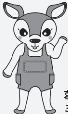
葛飾区立図書館キャラクター ミルシカ

今まで仕事や学校の時間の都合などで来館できなかった方や、来館することが難しい方にも気軽にご利用いただけます。