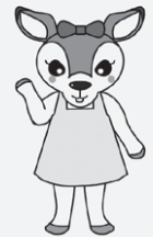
葛飾区立図書館キャラクター シルシカ

https://www.lib.city.katsushika.lg.jp/contents?pid=7981