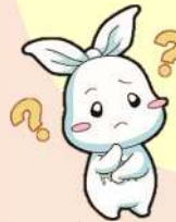
葛飾区ごみ減量・3R推進キャラクターリー(Ree)ちゃん