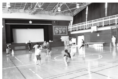
わくわくチャレンジ広場

令和3年度は、新たに1校の運営を事業者の一部委託し、計6校のわくわくチャレンジ広場で、児童指導サポーターの活動を事業者がサポートしながら連携して児童の見守りを行います。