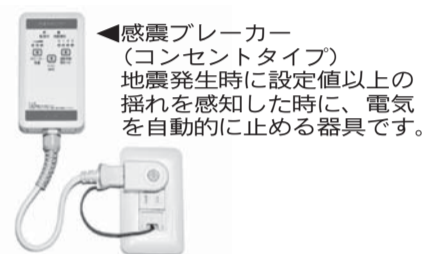
▲感震ブレーカー(コンセントタイプ)地震発生時に設定値以上の揺れを感知した時に、電気を自動的に止める器具です。