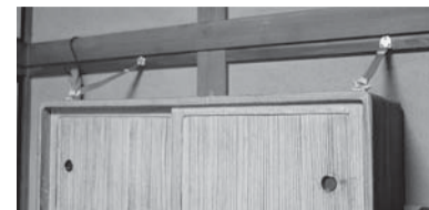
▲たんすに設置した転倒防止器具