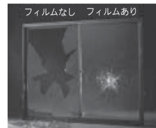
▲ガラス飛散防止フィルム