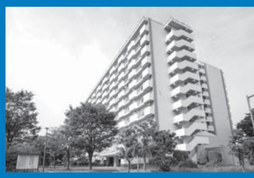
JR常磐線(東京メトロ千代田線直通)「金町」駅徒歩10分