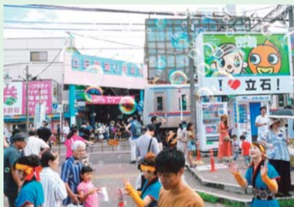
「シャボン玉の有る駅前」 齋藤力