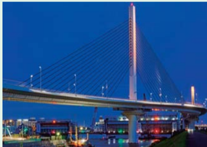
「かつしかハーブ橋」 笠井忠