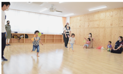
うんどう会の様子 ※催しへの参加は予約制です。

(鎌倉1 - 7 - 3) ☎03 - 3658 - 1800 妊娠期の方から高校生世代までの子どもが利用できる総合的な子育て支援施設です。「いつときあずかり」も利用できます。