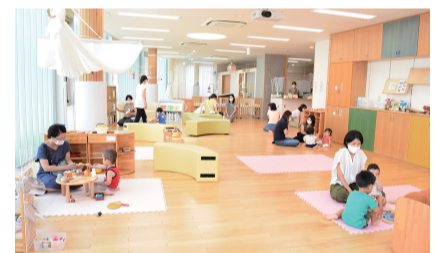
子育てひろば いろは ☎03 - 6240 - 7591 ※利用には予約が必要です。

(青戸4 - 15 - 14 健康プラザかつしか内) ☎03 - 3602 - 1386 子育て全般に関する相談ができます。また、乳幼児と保護者が気軽に集い、学び、支えあう場として子育てひろば、親子カフェを設けています。