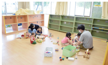
子育てひろば まるまる ※人数制限があります。

(東金町3 - 8 - 1) ☎03 - 5699 - 1224 乳幼児と保護者が楽しく遊びながら子ども同士、親同士が交流できる場です。子育てひろばの他、小・中学生、高校生が遊べる部屋もあります。