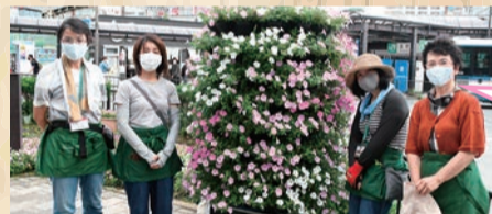
花いっぱいでおもてなしサポーターの皆さん(金町駅前)

フラワーメリーゴーランドのお手入れをするボランティアです。活動に興味がある方は環境課へお問い合わせください。