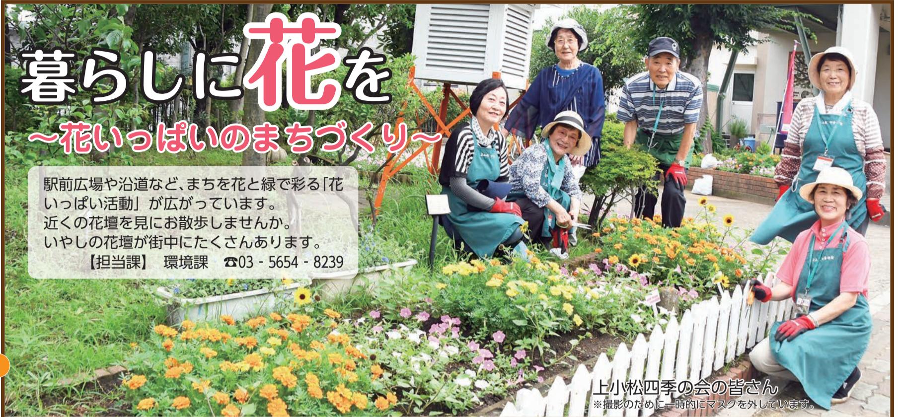
上小松四季の会の皆さん