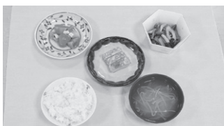
江原 大輔(幸田小6年) 貧血対策 いろいろ朝食