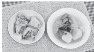
廣川 清哉(綾南小6年) たっぶり野菜のポトフ・ふんわり やわらかフレンチトースト