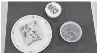
菅原 凜(上平井小6年) 元気になる朝ご飯