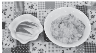
奥田 泰成(葛飾小5年) 1さいから食べられる! 洋風トマトがゆ