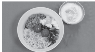
水井 煌太(金町小5年) 七種の和朝食