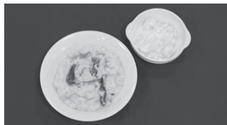
中村 紗雪(花の木小3年) とってもかんたん!小松菜とかにかまの リゾット&バナナはちみつヨーグルト