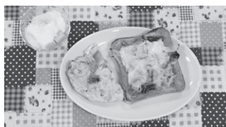
野沢 秋登(細田小5年) 野菜たっぷりもりもりごはん