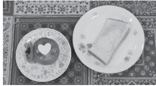
市倉 恵実(花の木小6年) サッパリ! トマトシーチキン