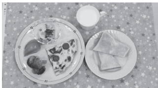
森 莉桜(金町小5年) 夏野菜オムレツ