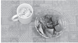
石動 天空(東水元小6年) マグカップでトマトチーズリゾット