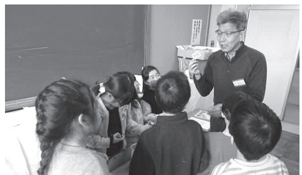
学校地域応援団の活動(昔遊び)

・夏季休業日の小学校3校において、児童が自主的に活動する場を提供し、その見守りを行います。