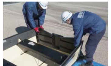
救助用ボートの組み立て方編

令和2年度は「学校避難所の初動開設の方法編」と「救助用ボートの組み立て方編」を制作しました。