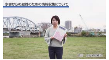
水害からの避難のための情報収集について

区では、猛烈な台風や大雨による水害に備えるため、新しい水害ハザードマップを作成し、全戸配布しました。ハザードマップには、河川が氾濫したときの自宅や勤務先などの浸水の深さや避難の仕方が載っており、いざというときに備えて、どのような防災行動をすれば良いのか整理できるようになっています。