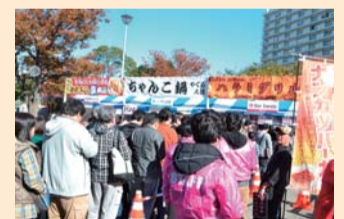
昨年は約80,000人が来場!