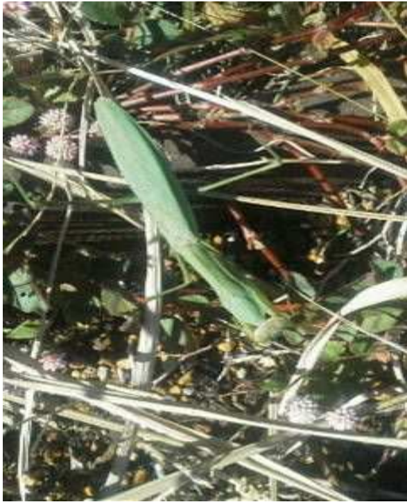
11/6 カマキリ ↑