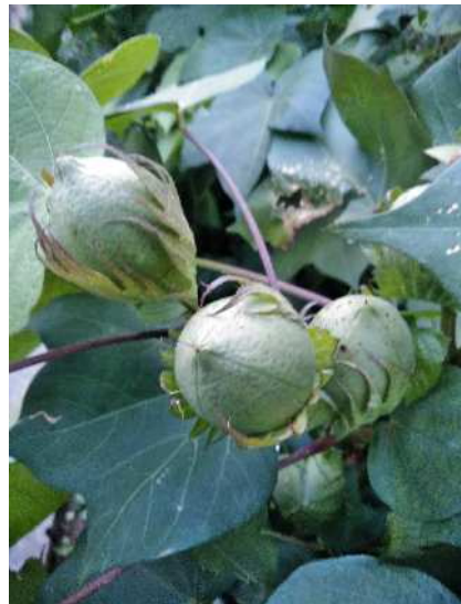
「これ何の実？」 10/3 場所：清和小 名前：Rさん