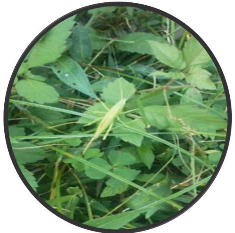
11/25 セスジツコムシ ↑