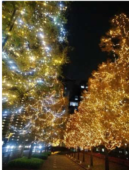
「理科大前」 11/27 場所：新宿 名前：Rさん