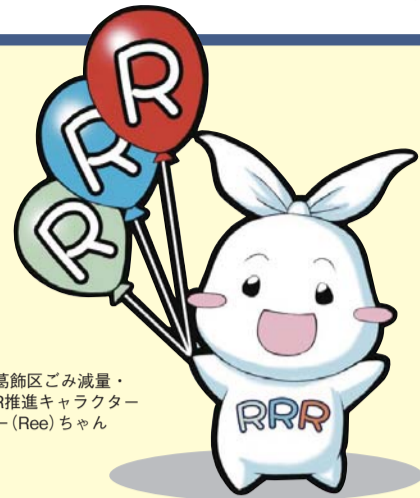
▶葛飾区ごみ減量・3R推進キャラクター「リ- (Ree) ちゃん」