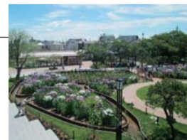
静観亭から見た菖蒲園

少人数から70人程度の会合・法事・宴席などに利用できます(椅子席でのご利用、食事なしでの利用も可能です)。