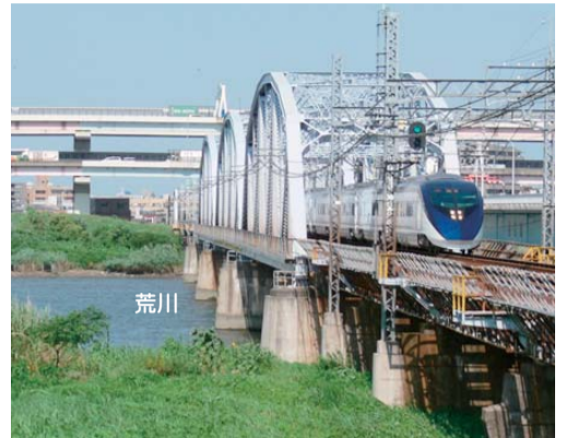
現在の京成本線荒川橋梁

対策として一帯の堤防のかさ上げを行いました。しかし、京成本線荒川橋梁が支障となり、現在も橋梁および近接堤防は周辺堤防の高さより低く、荒川増水による被害の可能性が高くなっています。