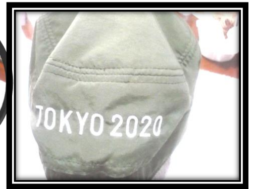
B-2 オリンピックマーク入りワークキャップ ↑