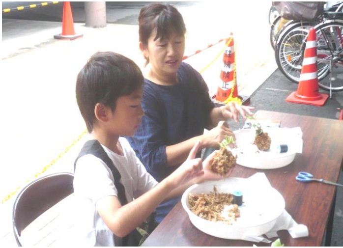
B-3 アイビーコケ玉制作と完成したコケ玉 ↑