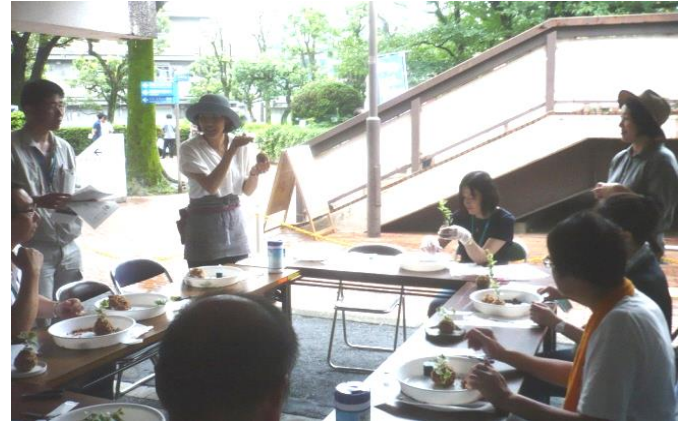
A-2 ミニ園芸教室担当の緑化推進協力員事前研修