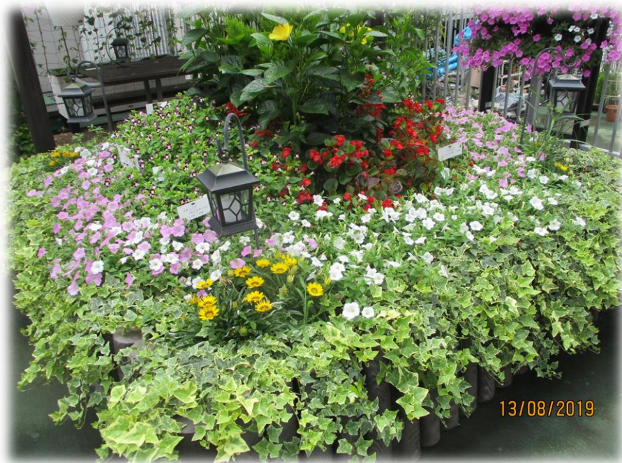
区役所 緑と花のいこいガーデンの花壇

今まで花壇で育てた中で育てやすい花は、アングロニア、ペンタス、ブルーサルビア、トレニア、ジニア、ベゴニア、ポーチウラカ、マリーゴールド、コリウス、ハツユキソウ。花がらつみも大事な作業ですが、私が参加している区役所内の緑と花のいこいガーデンで活動するガーデンプロジェクト12、金町駅南口で活動するフラワーキープの会、水元公園グリーンプラザ友の会で育てやすい花苗を紹介しました。追加で、ペチュニアのさくらさくらシリーズが夏一番元気ですね。