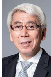
ナレーター 吉田照美 さん (かつしか観光大使)

かつしか観光大使の内山信二さんが、地元葛飾でしか出会えない人、葛飾でしか経験できないイベント、葛飾でしか食べられない物など、葛飾ならではの魅力を求めて区内を巡る情報バラエティです。