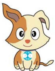
行政相談マスコット キクーン