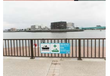
奥戸総合スポーツセンター船着場