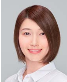
ゲスト出演 狩野舞子 さん (元パレーポール日本代表)