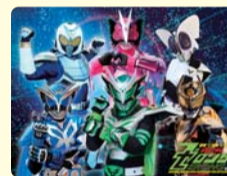
▲かつしかの環境を守るため、ゼロング参上!