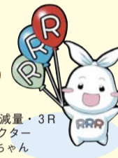
▶ 葛飾区ごみ減量・3R推進キャラクターリー(Ree)ちゃん