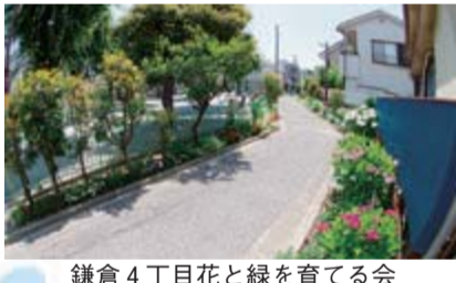
鎌倉4丁目花と緑を育てる会(鎌倉4-27)

エントリー花壇は、かつしか花いっぱいのまちづくりホームページ( https://www.hanaichi-katsushika.jp/ )でも紹介しています。右のQRコードからもアクセスできます。