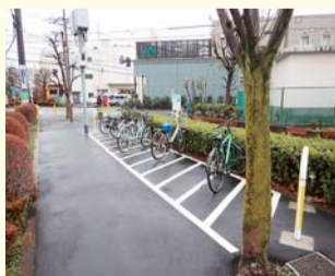
▲サイクル&バスライド