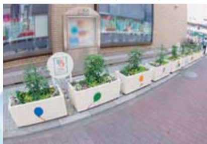
亀有花風船の会(亀有3-23先)