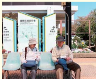
▲バス停に設置したベンチ

また、鉄道駅のエレベーターやエスカレーターの整備によるバリアフリー経路の確保、ホームドア整備などを鉄道事業者と協働して進めます。