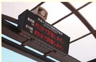
▲バスロケーションシステム