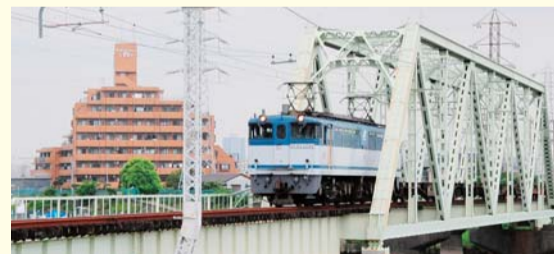
▲現在の新金貨物線

旅客化の実現には、国道6号との交差などの課題があり、こうした課題の解決に向け、車両を速やかに通過させる方法など、今後、関係機関との協議を進めながら検討を行います。