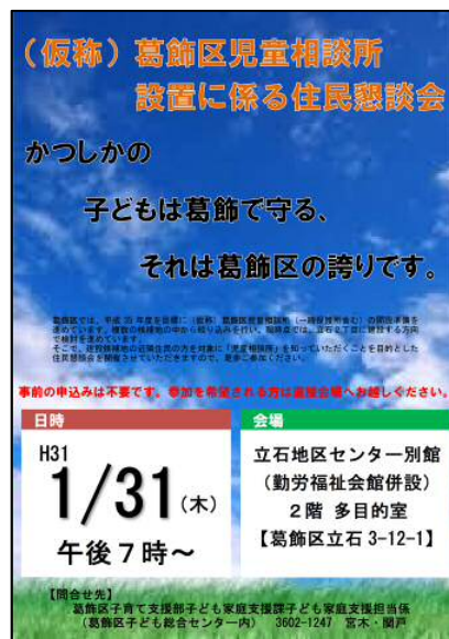
▲今回の開催をご案内させていただいたチラシです。「青い空」「白い雲」は、児童相談所や一時保護所の利用を通じて、被虐待児が虐待から解放され、未来に向けて大きく羽ばたいてほしいという願いが込められています。