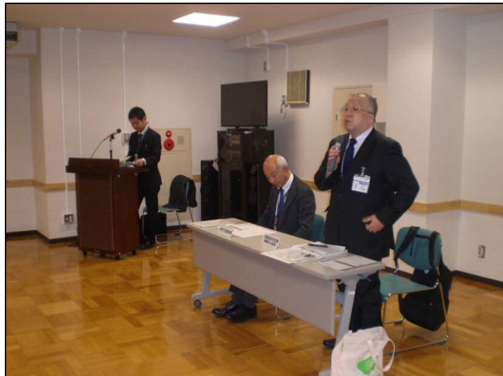
▲忠児童相談所設置準備担当課長説明