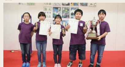
新宿地区代表の皆さん