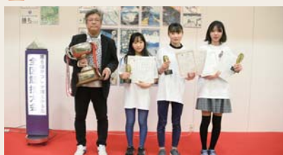
新小岩北地区代表の皆さん