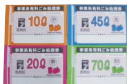
▲事業系有料ごみ処理券