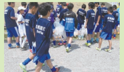
江戸川クリーン大作戦の様子

平成27年度は約42,000人、 241団体が参加し、 約40トンのごみを 回収しました!