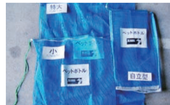
資源回収用ネット