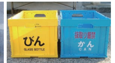
資源回収用コンテナ