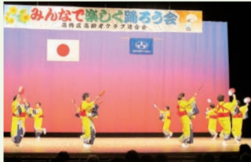
楽しいイベントも盛りだくさん!