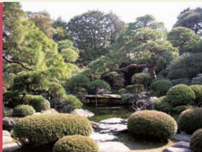
▲「山本亭」主庭の眺め

アメリカの日本庭園専門誌『Sukiya Living/The Journal of Japanese Gardening』が、全国90カ所以上の名所旧跡を対象に実施した「2015年日本庭園ランキング」において、山本亭が 全国3位 に選ばれました。