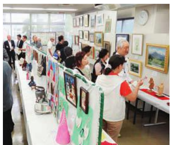
新宿地域の皆さんが制作した手芸品や絵画など、さまざまな作品を展示します。6月24日(土)・25日(日)午前10時～午後3時 会担新宿地区センター(新宿4-1-10) ☎(3600)6062

区の手続きや催し物の問い合わせ、がん検診の申し込みは はなしようぶコール(6755)2222 午前8時～午後9時 年中無休 FAX(6758)2223