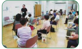
脳力トレーニング体験会