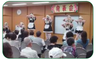
自主グループの発表会