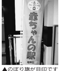
▲のぼり旗が目印です

外出時におむつ替えや授乳などを行える赤ちゃんの駅を1カ所新設しました。今回新設した施設を含めて52カ所に設置しています