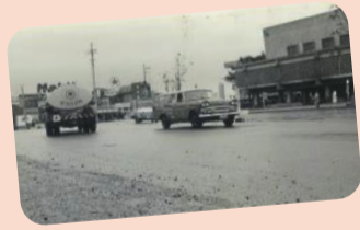
シリーズ 葛飾と水⑥ 用水から親水公園へ シリーズ 葛飾から全国へ 映画「男はつらいよ」 漫画「こちら葛飾区亀有公園前派出所」 漫画「キャプテン翼」