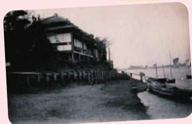
シリーズ 葛飾と水① 近代以降の水害年表