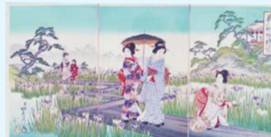
シリーズ 葛飾と水② 船橋と曳舟 シリーズ 葛飾と水③ 葛西用水とふたつの溜井