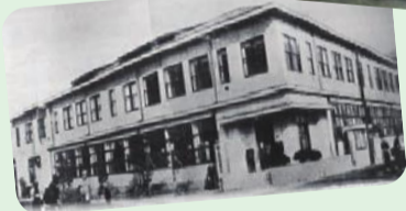
シリーズ 葛飾と水④ 河川と産業 シリーズ 葛飾と水⑤ カスリーン台風と水塚