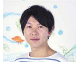
ふるいち のりとし 古市 憲寿氏 (社会学者)

著書『絶望の国の幸福な若者たち』でユニークな若者論を展開し、各方面で注目を集める気鋭の社会学者・古市氏が、「若者」をキーワードに新たな視点から社会を見つめ、現代社会における幸福とは何かについてお話しします。