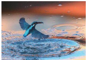
平成28年度入選作品 朝のカワセミ

水元小合溜周辺に生息する生き物の写真を展示し、来場者の投票で入選作品を決定します。入選作品はポストカードにして後日販売します。詳しくは応募要項をご覧ください。