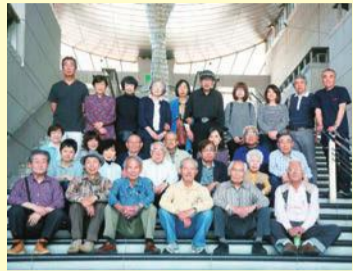
葛飾区美術会の皆さん

区役所やかつしかシンフォニーホール(立石6・33・1)などの区施設に美術品が展示されているのを「ご存じでしょうか。これらは、葛飾ゆかりの美術家たちで結成された葛飾区美術会から提供された作品で、地元的美術家を応援するために区が展示場所を提供しています。葛飾区美術会は、平成3年に区内の美術家によって結成されました。日本画、水墨画、油彩から刀剣、彫刻など、幅広いジャンルの美術家で構成されています。葛飾は古くから職人が多く住む土地だったこともあり、工芸品に分類されそうなジャンルも含まれているのがこの会の特徴です。