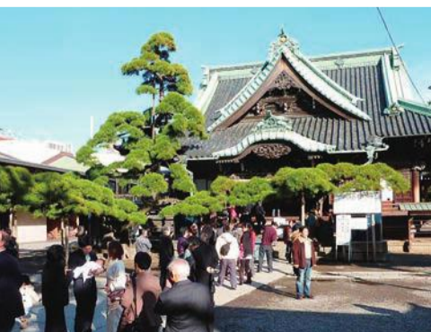
▲帝釈天題経寺の境内

葛飾柴又の文化的景観が国の重要文化的景観に選定へ 【担当課】 郷土と天文の博物館 ☎(36838)1101 11月17日に開催された国の文化審議会は、「葛飾柴又の文化的景観」を国の重要文化的景観として新たに選定することを文部科学大臣あてに答申しました。今後、官報告示により正式に決定されると、都内初の国の重要文化的景観となります。 葛飾柴又の文化的景観は、近世初期に開基された帝釈天題経寺と近代以降に発展したその門前を中心に、それらの基盤となった農村の様子を伝える旧家や寺社などの景観がその周囲を包んでいます。さらにその外側に19世紀以降の都市近郊の産業基盤や社会基盤の整備の歴史を伝える景観が広がり、水路の痕跡や道などもよく残っています。 このように、葛飾柴又は地域の人々の生活、歴史、風土などによって形成され、それらを現在に伝える重要な景観地として評価されました。