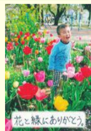
長谷充浩さんの作品