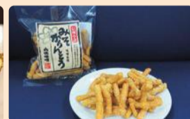
みそかりんとう(長野県小諸市)