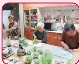
利用者が協力して料理に挑戦しています

利用者同士で買い物や料理などを協力して行ったり、職員や家族と一緒に参加する季節ごとのイベントや日帰り旅行を開催したりするなど、施設ごとにさまざまな取り組みが行われています。