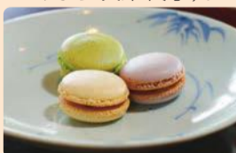
ようかんまかろん(佐賀県小城市)

特設会場では各地のご当地スイーツ、山本亭(柴又7-19-32)では期間限定の喫茶メニューが販売されます。お買い上げの方には、寅さんサミットオリジナル缶バッジや江戸つまみかんざしなどが当たる「ガチャガチャ」の抽選券をプレゼントします(ガチャガチャは無くなり次第終了)。