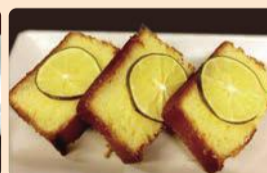
日南レモンケーキ(宮崎県日南市)