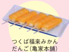
つくば福来みかん だんご(亀家本舗)