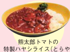
熊太郎トマトの 特製ハヤシライス(とらや)