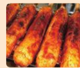
みそつけたんぼ (秋田県鹿角市)

「地元を象徴するものづくり」～原風景を守り、育ててきた人の営み～ 各地域の「ものづくり」をテーマに参加地域の皆さんと語り合います。