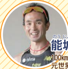
のうじょう ひでお 能城 秀雄さん 100kmウルトラマラソン 元世界ランキング1位