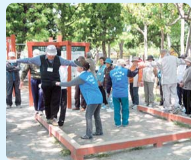
うんどう教室実施公園

専門の指導員がお手伝いしますので、初心者の方でも楽しめます。 【対象】 区内在住おおむね65歳以上で自分で会場まで来られる方