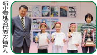
新小岩地区代表の皆さん