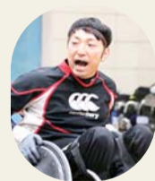
官野一彦さん(リオデジャネイロパラリンピックウイールチェアラグビー銅メダリスト)

スペシャルゲストと一緒に「車いす競技」などを体験します。3月20日(火)まで参加者を募集します。申込方法など、詳しくは生涯スポーツ課(☎3691-7111)へお問い合わせください。