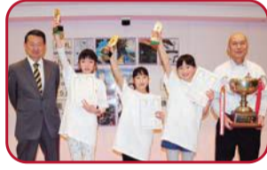
新小岩北地区代表の皆さん