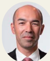
和田一浩さん(アテネオリンピックヒック野球日本代表)