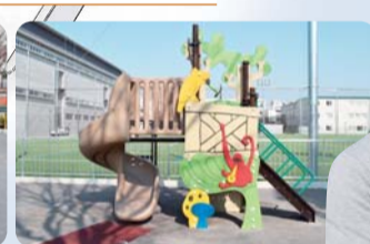
どうぶつ遊具広場