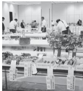
区内で生産された農産物の出来栄えについて審査します。審査員には区内産新鮮野菜を差し上げます。