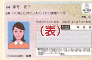
マイナンバー(個人番号)カード