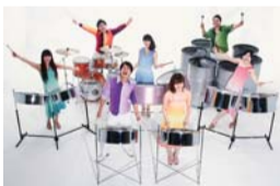
スティールパンオーケストラ「PAN NOTE MAGIC」

ドラム缶を加工して作る楽器「スティールパン」や、オーストリアのシュランメル音楽、スペインのフラメンコギターなどを生演奏します。