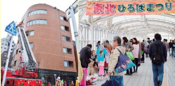
今年の「新小岩駅東北ひろばまつり」は10月6日(土)に開催されます。詳しくは5面をご覧ください。

トが行われるのか楽しみにしてくれています。また、新小岩地域は悲願の新小岩駅南北自由通路の開通により利便性が大幅に向上し、北口はきれいに整備されました。生まれ変わった新小岩の街をたくさんの方に知ってもらおうとともに、新小岩が葛飾の南の玄関口として今までよりもっと愛される地域となるよう、さまざまなイベントを企画していきます」と話してくれました。