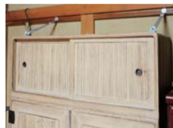
たんすに設置した転倒防止器具