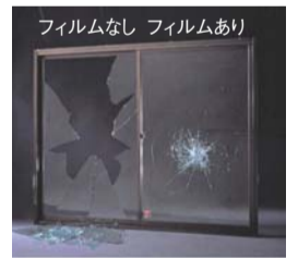
フィルムなし フィルムあり

関係機関のお知らせ 公証週間 無料電話相談 10月1日(月)～7日(日) (内容)遺言・任意後見など公正証書の作成(相談電話番号) ☎(3502)8239(受付時間)午前9時30分～正午・午後1時～4時30分(問い合わせ)葛飾区公証役場 ☎(66)0120(662)556