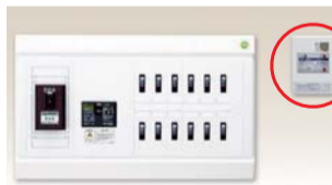
分電盤外付けタイプ