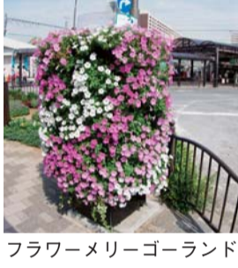
フラワーメリーゴーランド

花いっぱいでおもてなしサポーターを募集します JR金町駅・新小岩駅前や区役所に設置しているフラワーメリーゴーランドのお手入れを行うボランティアです。 【対象】 区内在住・在勤の方 【申込方法】 9月25日(火)午前9時から電話で。 【申し込み・担当課】 ☎(5654)8239