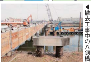
撤去工事中の八剣橋

現在、既設の八剣橋と八剣橋人道橋の撤去工事を行っています。完成は平成37(2025)年を予定しています。残る2橋(細田橋・高砂諏訪橋)についても、順次架け替えを行っていきます。