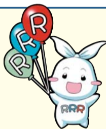
葛飾区ごみ減量・3R推進キャラクターリー(Ree)ちゃん