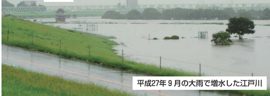
平成27年9月の大雨で増水した江戸川

葛飾区は土地の低さのため、大雨などで河川が氾濫し、洪水が発生すると、長ければ2週間以上に渡って浸水が継続する場合があります。