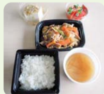
配達される お弁当の一例