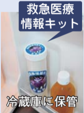
救急医療 情報キット