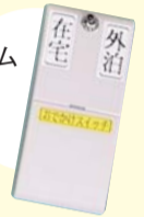
生活リズム センサー

在宅中にトイレのドアなどに取り付けしたセンサーが24時間反応しなかったときに、自動的に警備会社に発信され、係員が電話で安否確認します。また、状況に応じてご自宅に駆け付けます。