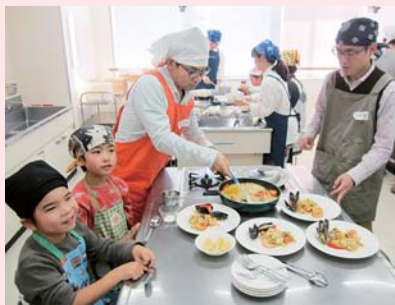
「パパと一緒にクッキング」の風景