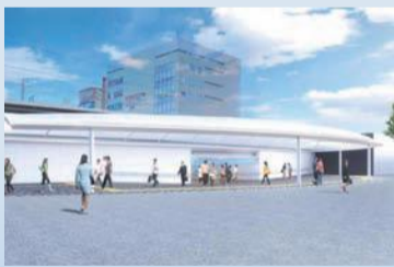
北口完成イメージ図 (平成31(2019)年夏頃完成予定)