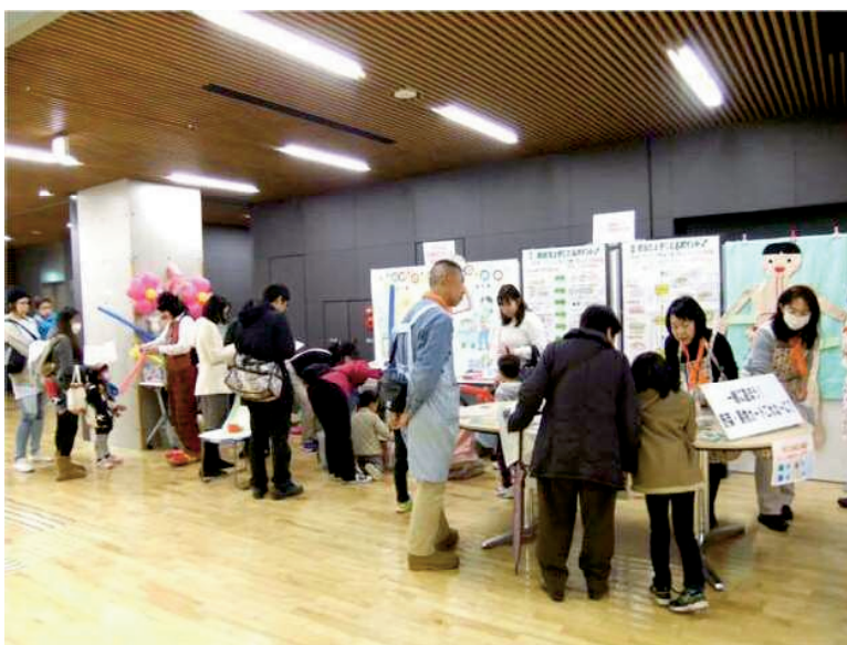
▼レシピと一緒にカルシウムを多く含む食品の紹介などをしました。