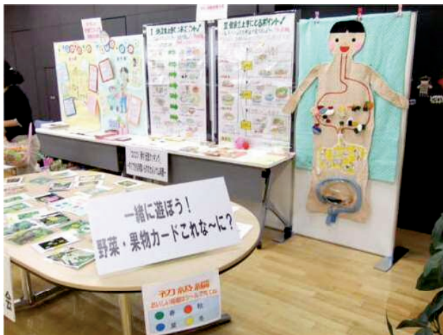
▼パネル展示の様子