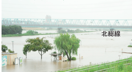
平成27年9月の大雨で増水した江戸川

区内131カ所に設置している防災行政無線を通じて、大規模水害発生時における避難情報の訓練放送を実施します。訓練放送ですので避難は必要ありません。