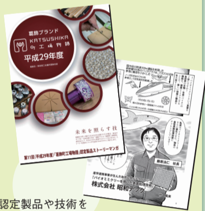
認定製品や技術をマンガで紹介します

葛飾の町工場で生み出された他では見られない優れた技術による製品やその技術を認定し、誕生するまでのエピソードなどを交えてストーリー性豊かに紹介していきます。認定製品は、展示会への出展やホームページでの宣伝など、積極的にPRを行います。認定企業からは、「葛飾ブランドによる見本市などの出展がきっかけで企業同士の交流が深まり、販路拡大に役立った」との声が寄せられています。