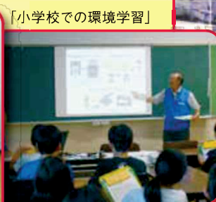
「小学校での環境学習」