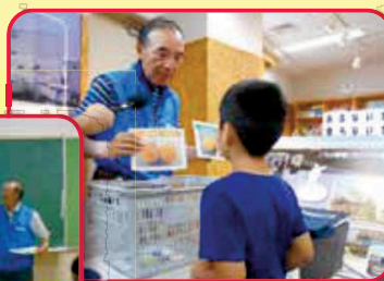
「ごみ減量・清掃フェア等のイベント」