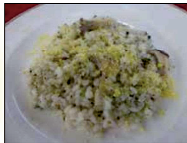
お茶とキノコのリゾット